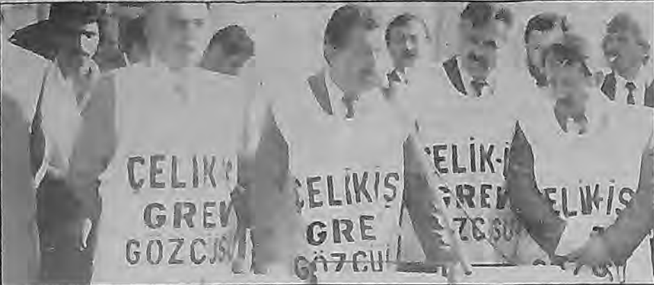
Celik-iş ve Özdemir-iş ile olan "birlik" serüveninde hüsrana uğrayan Otomobil-iş, "birlik sorusunun cevabı Türk-iş'tir" diyor. "Çağı yakalamak, güçlü olmak" maskesi altında sınıf mücadelesini, işçi sınıfının varlığını reddediyor. "Neden Türk-iş, Nasıl Bir Türk-iş?" broşürü, bu reddiyein son ifadesi.

TÜRK-İŞ'TE DEĞİŞEN NE? Bu broşür, Otomobil-iş Genel Merkez Yöneticilerinin, işçi sınıfının mücadelesine, si-