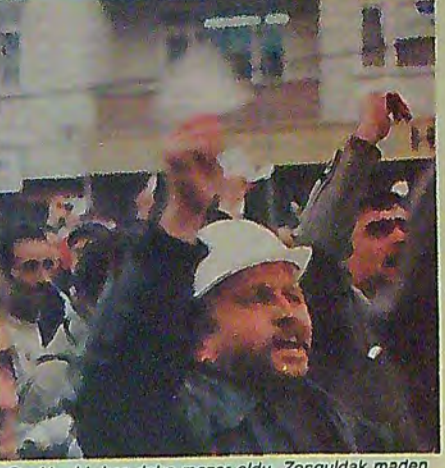
Ocaklar bir kez daha mezar oldu. Zonguldak maden işçisi, daha ocaklara inerken, soğukkanlılıkla kabullenmediği ölümü bu defa Kozlu'da gördü. Maden işçileri 254 arkadaşlarının yasını tutup yaralarını sarmaya çalışırken bir de "Bu ocaklar kapatılsın" diyen mezar soyguncuların seslerini işitince, yastı bekleyiş gergin bekleyişe dönüştü.

yanarak zincirleme patlamalara yolaçması ve ocak içlerinde oluşan alev fırtınaları çok sayıda maden işçisinin ölümüne yolaçtı.