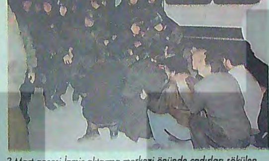
3 Mart gecesi İzmir aktarma merkezi önünde çadırlar sökülürken işçiler gözaltına alındı.

100. gününe yaklaşan Yurt İçi Kargo direnişinde, işçiler mücadeleye dolu bir ay daha geride bıraktılar. Bu bir ay içinde yine yoğun bir polis terörü yaşandı. Direniş polis saldırısıyla ve sonrasında yüzlerce işçinin gözaltına alınmasıyla bitirmeye çalışıldı. İşçilerin aktarma merkezleri önüne kurdukları çadırlar yıkıldı, işçiler dövülerek 2 gün gözaltında tutuldu. Sonrasında Bölge Müdürlüğü'nün önünde oldukça sesli geçen kısa bir bekleyiş süreci yaşandı. Ardından hem moral coşkuyu artırmak, hem de kargo işçilerine destek verilecek buluşmak için Altunizade'de düzenlenmek istenen şenlik, polis saldırısıyla engellendi. Hemen hemen tüm işçiler tartaklanıp, dövülerek gözaltına alındı. Kargo işçileri olayı yaptıkları basın açıklamasıyla protesto edip, valiliğe suç duyurusunda bulundular. İstanbul'da olduğu gibi