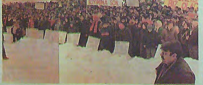
Bifa İşçilerinin mitingine Tekstil ve Belediye İşçileri Katıldı

(İşçilerin Sesi-Ankara) Bifa Bisküvi Fabrikası'nda yaşanan sorunlar hala çözülmedi. İşverenin tutumu tüm çabaların boşa çıkmasını sağlarken işçiler kendi deneyimlerine ve gücüne güvenerek ayakta kalmaya devam ediyorlar. Yaklaşık 350 kişinin iş akıllarını tek taraflı fesetme haklarını kullanmaları işvereni zor durumda bıraktı ancak fabrikada üretimin tam olarak durmasını sağlayamadı.