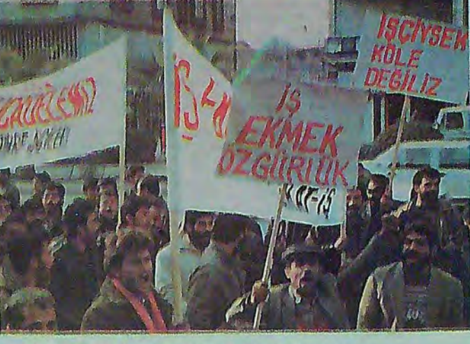
Devamı 7. sayfada Sendikal Hak Ve Zamlara Karşı Mitinginde Toros Gübre İşçileri